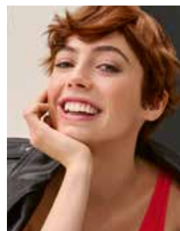
Unser Cover: Cut Alexander Dinter Color Gregory Le Hir Make-up Steffen Zoll

Stark Druck GmbH & Co. KG, Im Altgefäß 9, 75181 Pforzheim, Deutschland Wiedergabe von Artikeln und Bildern, auch auszugsweise oder in Ausschnitten, nur mit Genehmigung des Herausgebers.