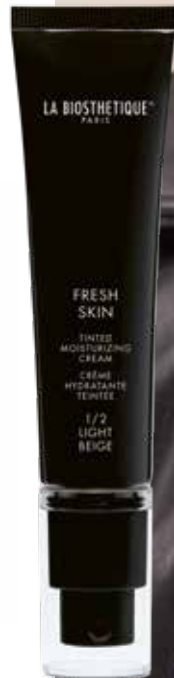
FRESH SKIN 1 / 2 LIGHT BEIGE