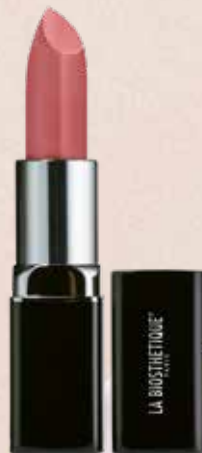
SENSUAL LIPSTICK B240 PEONY BLOSSOM