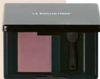
MAGIC SHADOW 50 SMOOTH PINK

Für glänzend glatte Looks: Heat Protector für Hitzeschutz beim Thermostyling.